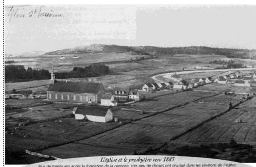
L'église et le presbytère vers 1883 Plus de trente ans après la fondation de la paroisse, très peu de choses ont changé dans les environs de l'église