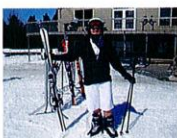
Un des nombreux skieurs à profiter de la glisse printanière... en shorts !

Les plus courageux d'entre vous ont même pu dévaler les pentes en tenue estivale !